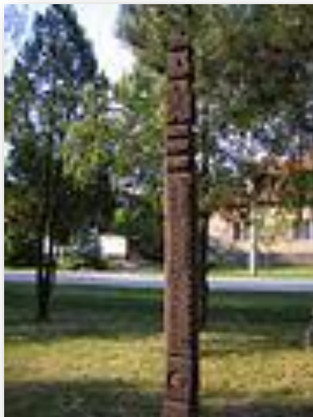
Kopjafa a templomkertben