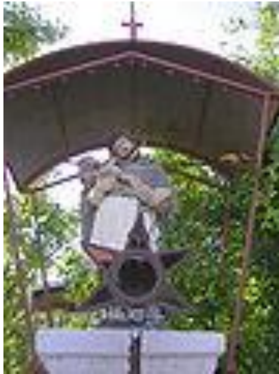
A Nepomuki Szent János-szobor