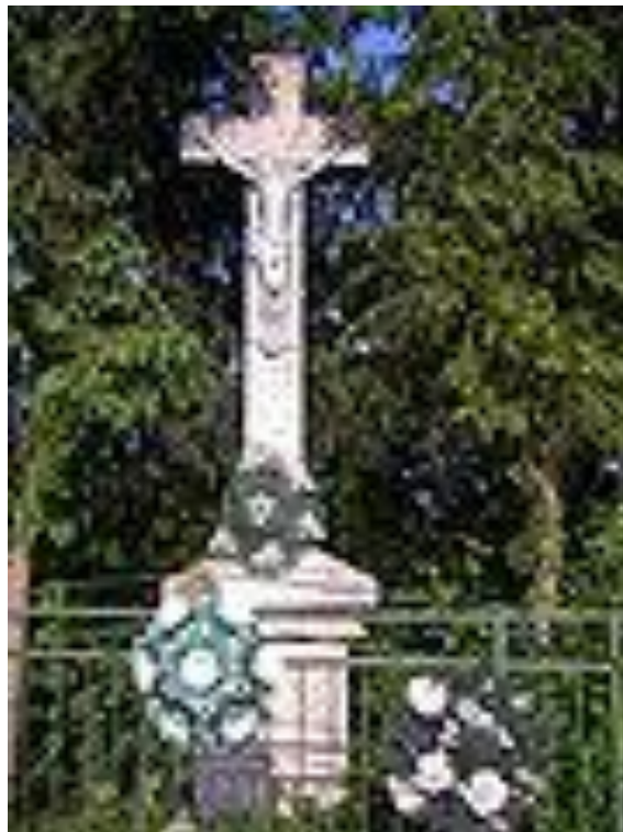
Kereszt az újvári út elágazásánál