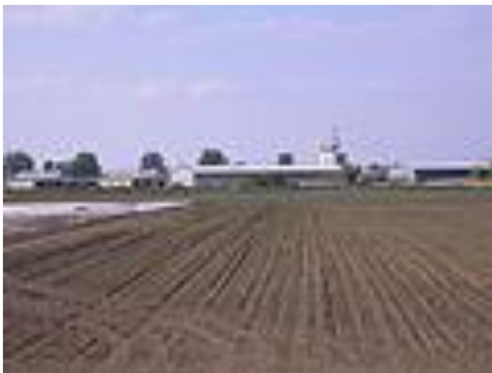
A szímói mezőgazdasági szövetkezet