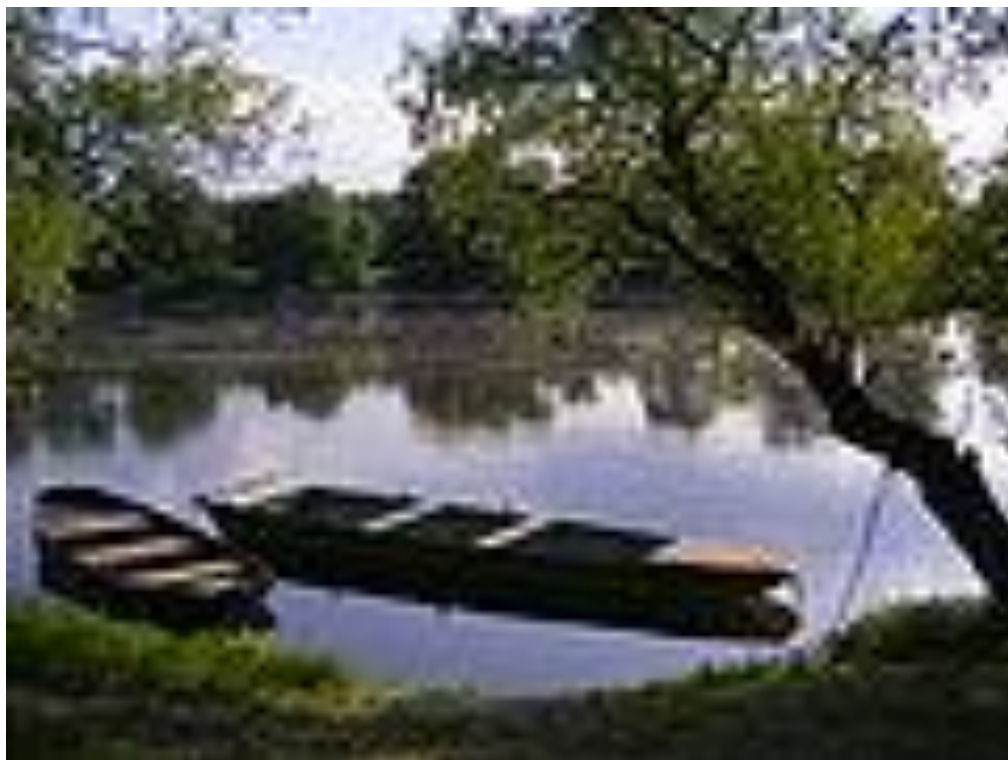
A szímói Vág-parton