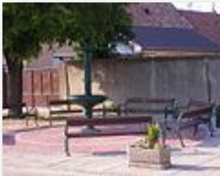
Szökökút a faluközpontban